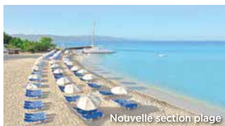
Nouvelle section plage

Situé directement sur une plage de sable blanc au cœur de Montego Bay, à distance de marche de la réputée «Hip Strip» et de ses nombreux restaurants, boîtes de nuit et boutiques.